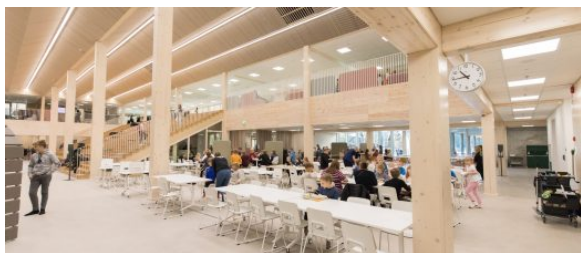
Kuva 2:

Ruokailu tapahtuu alakerran ruokalassa työjärjestyksen mukaisesti klo 11.45-12.15 tai klo 12.15-12.45. Koska jaamme ruokalatalan ala- ja yläkoulun oppilaiden kanssa, tulee ruokailuaikataulua ja ruokalan yleisiä ohjeita ehdottomasti noudattaa. Päättyviikolla puolen tunnin ruokatauko on klo 11.45-12.45 välisenä aikana.