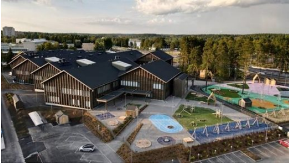
Kuva 1:

Imatran yhteislukio on vuonna 1908 perustettu yleislukio, jossa opiskelee noin 400 opiskelijaa. Imatran yhteislukiossa opiskelijat voivat toteuttaa yksilöllisesti omia ainevalintojaan. Tarjoamme hyvän opiskeluilmapiiirin, jossa arvostamme toisen ihmisen kunnioitusta, myönteisyyttä, itsenäisyyttä ja luovuutta.