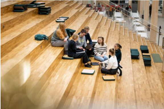
Kuva 5:

Kaikki opiskelijat kuuluvat Imatran yhteislukion opiskelijakuntaan. Opiskelijakunnan hallitus valitaan joka vuosi joulukuun yleiskokouksessa ja jokainen Imatran yhteislukion opiskelija voi hakea mukaan opiskelijakunnan hallitukseen. Hallitukseen valitaan tasavertaisesti 1. ja 2. vuosikurssin opiskelijoita (myös IB ja ISK). Hallitus valitsee keskuudestaan puheenjohtajan, joka johtaa hallituksen toimintaa.