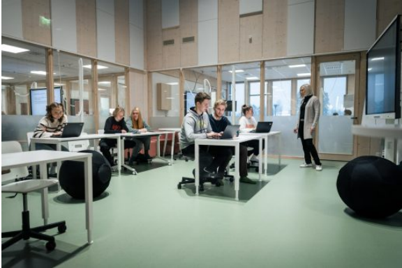
Kuva 3:

Nuorille tarkoitetun lukiokoulutuksen oppimäärän laajuus on 150 opintopistettä . Lukio-opinnot muodostuvat lukiokoulutuksesta annetun valtioneuvoston asetuksen (810/2018) liitteen 1 mukaisista pakollisista ja valtakunnallisista valinnaisista opinnoista , joita koulutuksen järjestäjän tulee tarjota opiskelijalle. Valtioneuvoston asetuksen mukaisia valtakunnallisia valinnaisia opintoja nuorille tarkoitetun lukiokoulutuksen oppimäärään tulee sisältyä vähintään 20 opintopistettä . Oppimäärään voi lisäksi sisältyä lukiodiplomeja ja muita valinnaisia opintoja koulutuksen järjestäjän päättämällä tavalla.